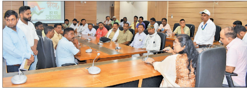
हरिभूमि न्यूज करनाल

नगर निगम आयुक्त ने कहा कि शत प्रतिशत डोर टू डोर कूड़ा एकत्रीकरण सुनिश्चित किया जाए और प्रमुख मार्गों पर विशेष सफाई हो। बीट में कहीं भी पुराना कचरा न रहे