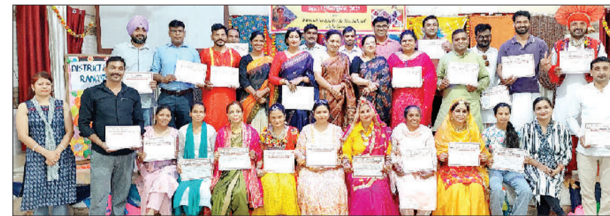
अंबाला। विभिन्न स्पर्धाओं में हिस्सा लेने वाले स्कूली छात्र।