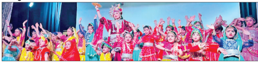
पानीपत। दयाल सिंह स्कूल में सांस्कृतिक कार्यक्रम पेश करते विद्यार्थी।