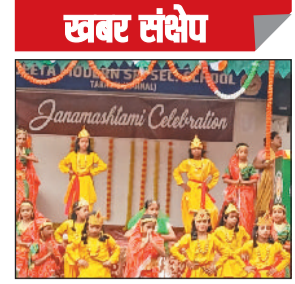
करनाल। स्कूल के बच्चों कृष्ण जन्माष्टमी महोत्सव में भाग लेते हुये।