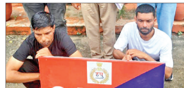
अंबाला। पकड़े गए हेरोइन तस्करों की आरोपी।

पुलिस नशा तस्करों के खिलाफ निरंतर कार्रवाई कर रही है। अब पुलिस ने हेरोइन तस्करों के मामले में दो आरोपियों को काबू किया है। आरोपियों के कब्जे से पुलिस ने डेढ़ करोड़ रुपये कीमत की 257 ग्राम 2 मिलिग्राम हेरोइन जब्त की है। अब पुलिस आरोपियों से गहन पूछताछ कर रही है। पुलिस द्वारा नशे